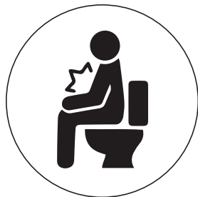
Pidodo ak pen loje