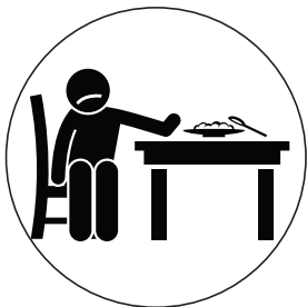
E jako kōņaan mōñā